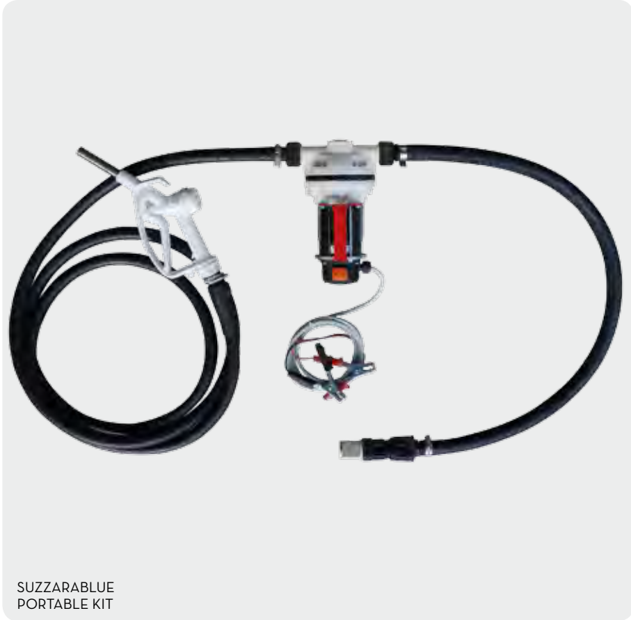
SUZZARABLU PORTABLE KIT